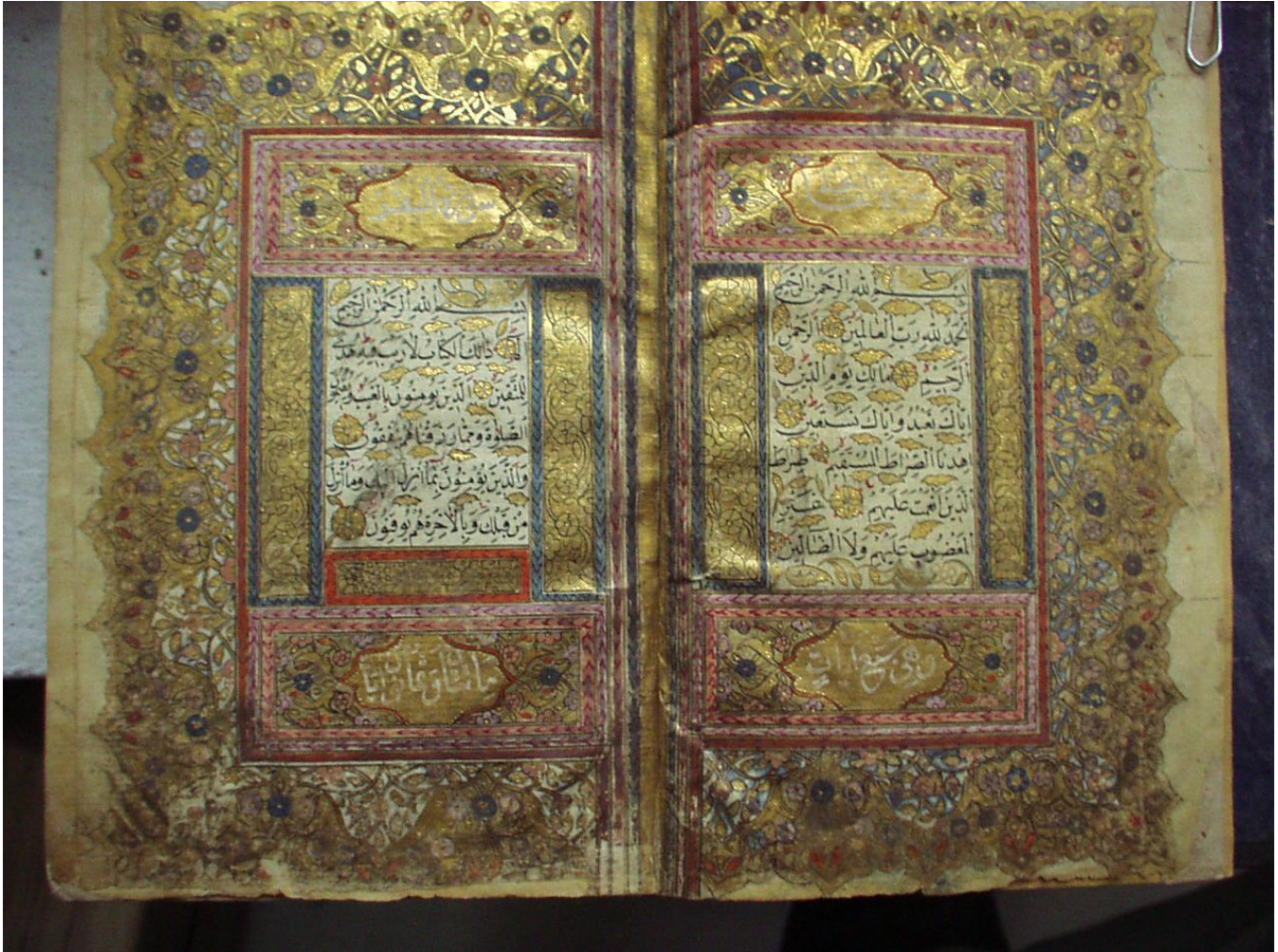
An illuminated page from an Arabic manuscript, an exquisite depiction of the early Islamic calligraphy

LANGSS-124 Fall and Spring Semesters 20124-20135